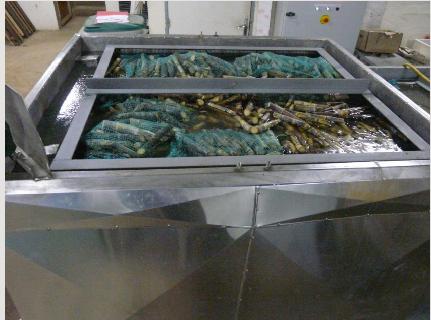
Pour l'assainissement des cannes, les boutures sont immergées dans le bac de thermothérapie